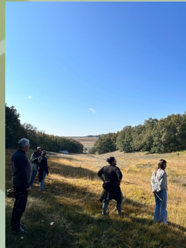
Villamartín de Don Sancho